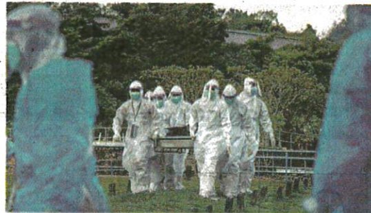
SEBAHAGIAN petugas sukarelawan mengusung jenazah Covid-19 untuk dibeumikan di Tanah Perkuburan Islam Raudhatul Sakinah, Bukit Kiara 1, Kuala Lumpur semalam.

"Secara keseluruhan, hanya 2,032 kes (11.7 peratus) daripada jumlah kes pada hari ini (semalam) mempunyai sejarah vak-