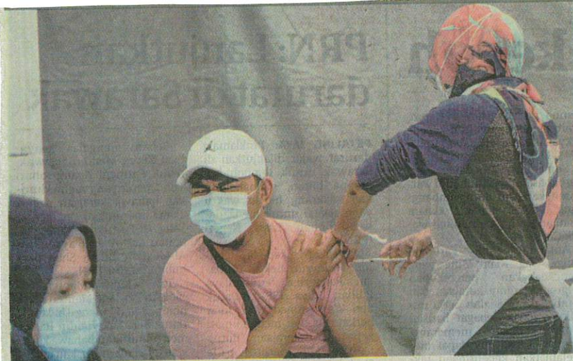
SEORANG penerima vaksin menahan diri ketika menerima suntikan dalam Program Vaksinasi Bergerak anjuran Wilayah Prihatin di PPR Perkasa, Jalan Nakhoda Yusof, Kuala Lumpur, semalam.

AKHBAR : UTUSAN MALAYSIA MUKA SURAT : 6 RUANGAN : DALAM NEGERI