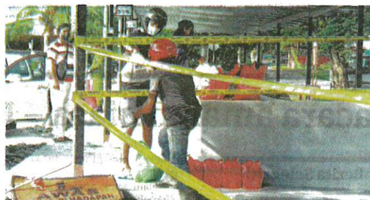
ORANG ramal meletakkan barang keperluan untuk ahli keluarga di tempat yang dikhaskan berikutan Taman Chembong Utama, Rembau dikenakan Perintah Kawalan Pergerakan Diperketatkan (PKPD). – IZZAT TERMIZIE

Kluster Taman Puteri Pulong juga melibatkan individu-individu yang menghadiri sebuah majlis sambutan perayaan dan penuliran kes-kes dilaporkan berlaku di Taman Puteri Pulong, Kubang Kerian, Kota Bharu.