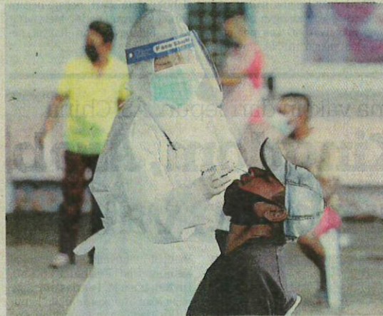
PENDUDUK menjalani ujian saringan Covid-19 di Perkampungan Portugis, Ujong Pasir, Melaka baru-baru ini.

Memetik kenyataan Menteri Kesihatan, Datuk Seri Dr. Adham Baba pada 23 Julai lalu, beliau berkata, sebuah konsortium ditubuhkan kerajaan bagi menjalankan usaha penjujukan semua genom sindrom pernafasan akut teruk virus korona kedua