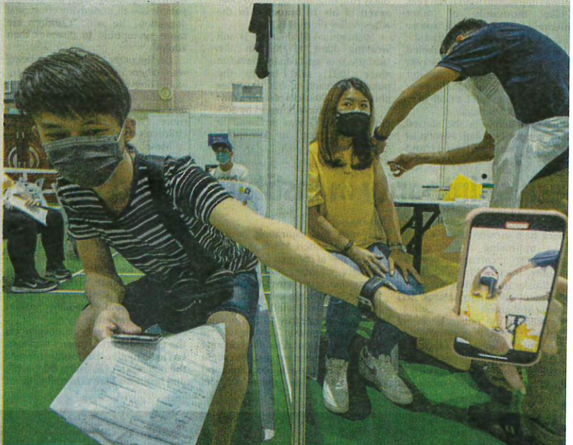
SHOT OF A SHOT ... A man takes a creative picture of a woman receiving her Covid vaccine jab at an inoculation center yesterday in Taiping, Perak.

"We do not want to fall into Thalidomide trap."