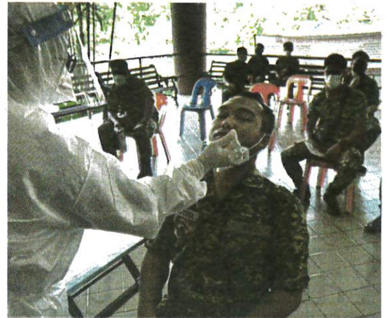
Petugas kesihatan membuat ujian calitan kepada paramedik Angkatan Tentera Malaysia susulan penutupan Hospital Medan di Dewan Serbaguna Perbadanan Labuan, semalam.

Sementara itu, Dr Noor Hisham berkata, melalui kajian ber-