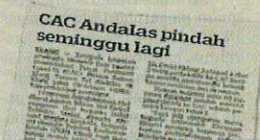
KERATAN Kosmo! 27 Julai 2021.

setempat sekiranya berhasrat mewujudkan CAC di mana-mana kawasan perumahan selepas ini.